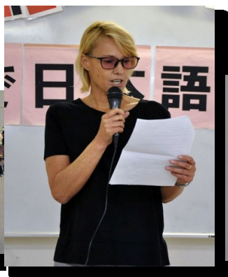
みんなでにほんごはなしましょう