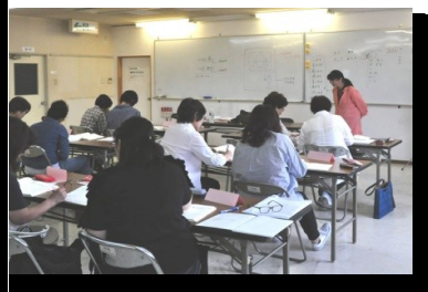
日本語指導者養成講座