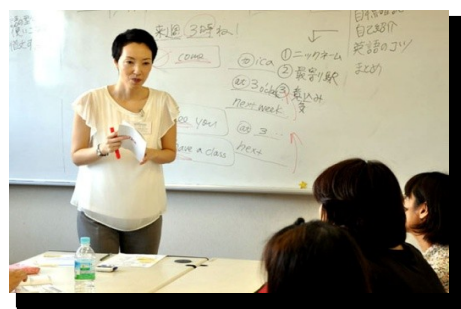
おもてなし語学研修