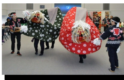
お正月を遊ぼう ～Enjoy New Year!～

2017年度も会員の皆さまの多方面における事業へのご協力ありがとうございました。安定した事業運営が続いていましたが、3月の移転によって状況が変化しました。